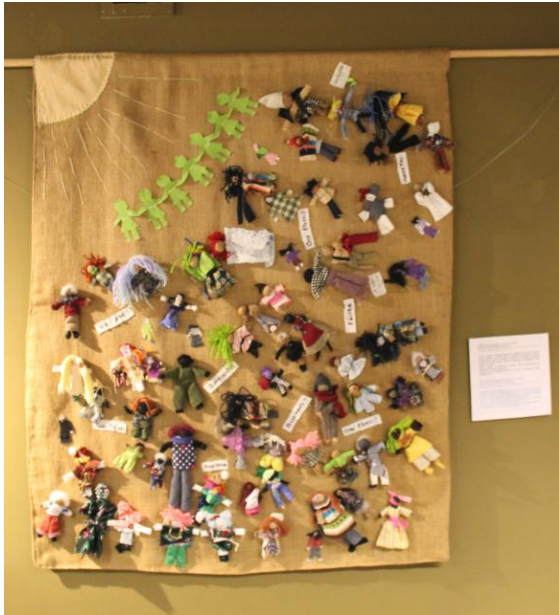
Bienvenida a los refugiados - Welcome refugees Pancarta para acciones noviolentas Arpillera de Gernika, País Vasco, colectiva, taller realizado dentro de las actividades del II Forum Internacional de Arpilleras, 2016