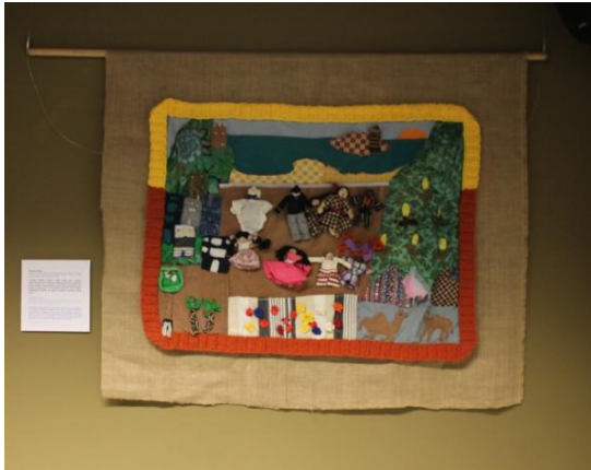
Familia del Mundo

Arpillera de San Sebastián, País Vasco, Grupo de Empoderamiento Femenino, Cruz Roja Guipúzcoa, taller realizado dentro de las actividades de la exposición COSIENDO PAZ: Conflicto, Arpilleras, Memoria , 2016