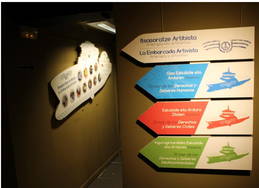
Vista parcial de la exposición

Arpillera de Gernika, País Vasco, Grupo de mujeres, Museo de la Paz de Gernika, taller realizado dentro de las actividades de la exposición COSIENDO PAZ: Conflicto, Arpilleras, Memoria , 2015-16.