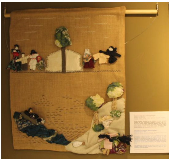
Bienvenida a los refugiados - Welcome refugees. Identificándose con éstos. Arpillera de Gernika, País Vasco, colectiva, taller realizado dentro de las actividades del II Forum Internacional de Arpilleras, 2016