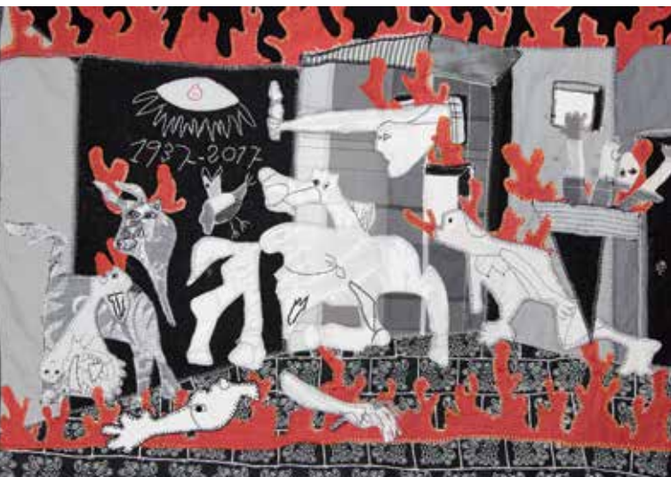
Foto: Martin Melaugh, © Conflict Textiles. Arpillera: Edurne Mestraitua.

Estas cinco voces nos hablarán de sus experiencias y proyectos artísticos que desarrollan a través de la artesanía textil con el objetivo de transmitir valores de convivencia, derechos humanos y una cultura de paz.