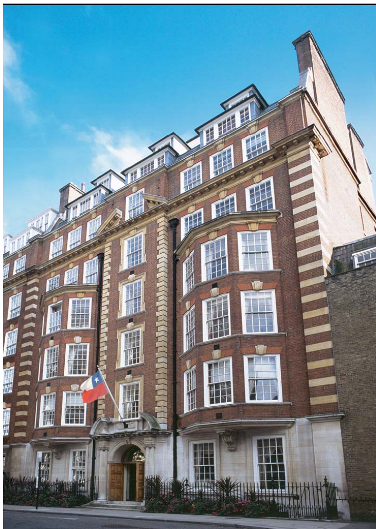
37-41 Old Queen Street, London, SW1H 9JA

Este edificio, adquirido por el gobierno de Chile, alberga desde julio a la cancillería de la embajada, el consulado, la misión naval y las agregadurías militar y aérea, las oficinas de PROCHILE, la delegación ante la OMI y la Anglo Chilean Society.